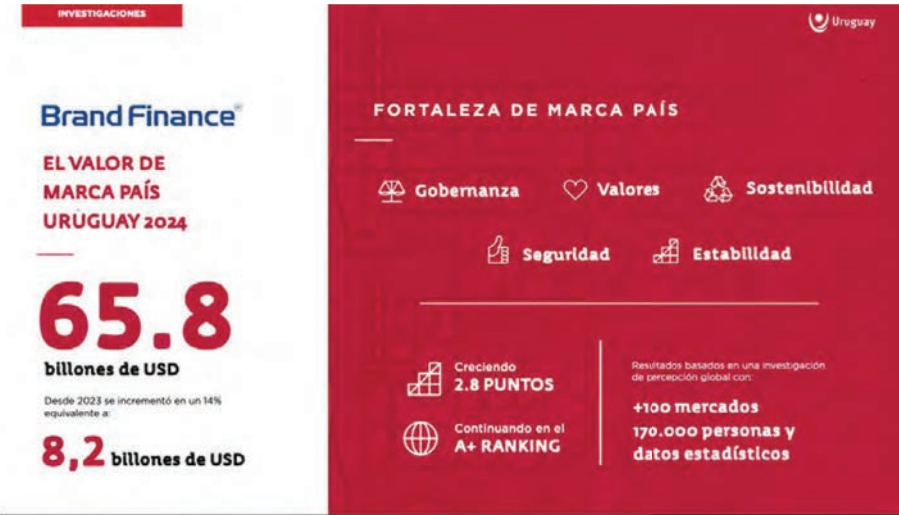
Tabla 6: Valor de Marca País Uruguay

La naturaleza misma del trabajo de LSQA implica la verificación sistemática de requisitos y la emisión de evidencia objetiva (certificados, informes de auditoría, registros de capacitación), lo que asegura que el impacto reportado es: