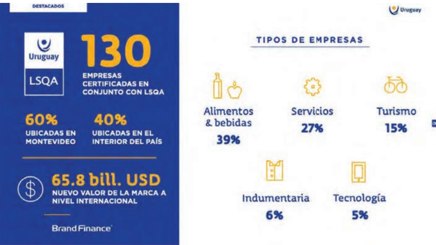
Tabla 5: Empresas certificadas Marca País Uruguay

Ver video de Uruguay XXI: Licenciamiento MARCA PAÍS + LSQA